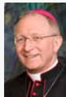
Diözesanadministrator Ulrich Boom, Weihbischof der Diözese Würzburg